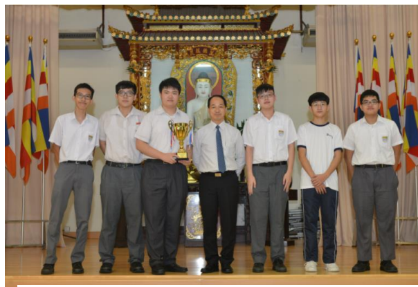
2020 VEXIQ 機械人美國公開賽香港區資格賽— 脈衝盃包攬技巧賽及競賽冠亞軍