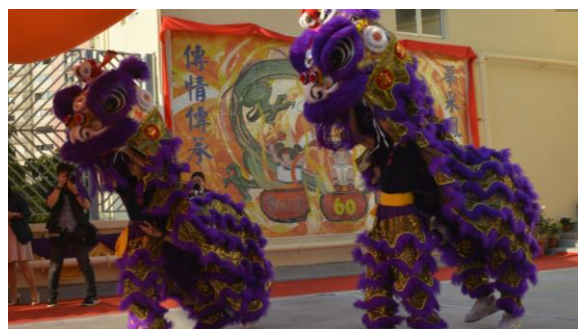
鑽禧校慶地標開幕禮