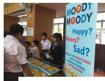
Happy English Time