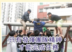
只有發揮團隊精神，才能完成任務。