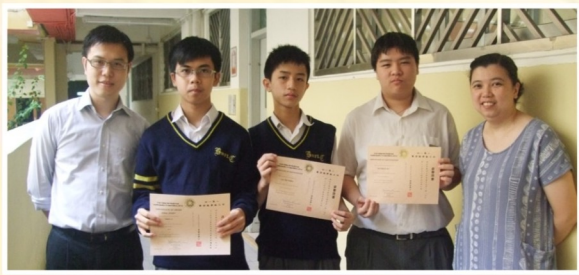
培正數學邀請賽出賽代表與兩位訓練老師