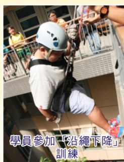
學員參加「沿繩下降」訓練

「在是次活動中，我最難忘的是睡地板。當初以為訓練營是高床暖枕，到了晚上才知道要睡地板，工作人員只給了我一張薄薄的毛毯，令我整晚也睡不着，這個時候我才知道，來這裏不是玩的，而是接受訓練的。經過一系列的活動後，我覺得自己變得有領導才能，就像在「傳木板」的遊戲裏，我領導了我組完成挑戰。以前我不會扮演領導的角色，這次活動讓我有機會學習領導，還認識了很多朋友。」