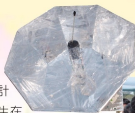
同學設計的太陽爐

「太陽爐設計比賽」是一項配合中三教學的活動。首先，學生在上學期通過連串的實驗，包括電腦模擬實驗，學習不同的「熱傳遞」方式。其後，學生利用課程所學的知識設計及製作「太陽爐」。到下學期四月的一個晴天，全級中三學生在午膳過後齊集到學校天台，為自己的「太陽爐」注入室溫的冷水，選擇爐的方向，並固定爐的位置。放學鐘聲響起，同學立即返回天台，紀錄升溫，比較設計與升溫的關係。其中一個爐因設計問題，上重下輕，被風吹倒，錯失勝出的機會。成績最好的一組，在短短個半小時內，水溫上升了32°C，學生都非常雀躍，他們的努力得到了肯定。雖然每班只有一組學生可獲「全班最高溫度上升獎」，但他們的科學知識已從活動中得到鞏固，求知欲也得到啟發。