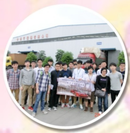
中得不銹鋼有限公司

這次考察，我認為最大的收穫是有機會和當地企業人員交流。透過交流，我知道了內地現時的經濟現況以及市場所擁有的巨大發展潛力，對有意北上發展的同學可謂甚具參考價值。」