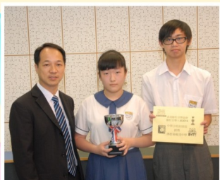
本校合唱團 獲聯校音樂大賽初級組銀獎