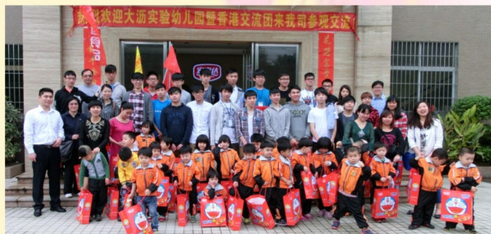
參觀企業活動宏士達食品有限公司