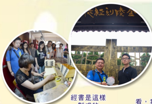
經書是這樣 製成的