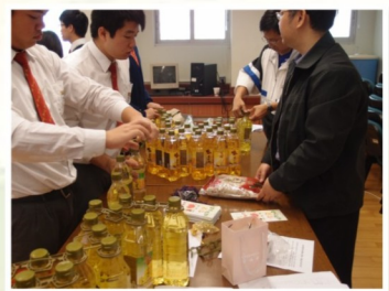
展翅社同學在探訪 老人家前忙於分配物資