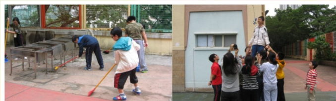
中一級德育培訓營

中三級方面，藉安排去年暑假參加了軍事夏令營同學的分享，帶出在軍營中著重紀律、服從及守規精神；中五級公民教育課更安排了廉政互動劇場《正義聯盟》，由中英劇團以互動話劇形式，帶出貪污的禍害及肅貪倡廉的重要。江蘇省政協委員羅盛慕嫻太平紳士、廉政公署總廉政教育主任陳禮傳先生及首席廉政教育主任蒞臨本校，一起參與，讓同學認識廉政公署的工作及致力維護香港廉潔的風尚。