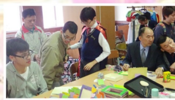
相中有「您」 — 相框製作