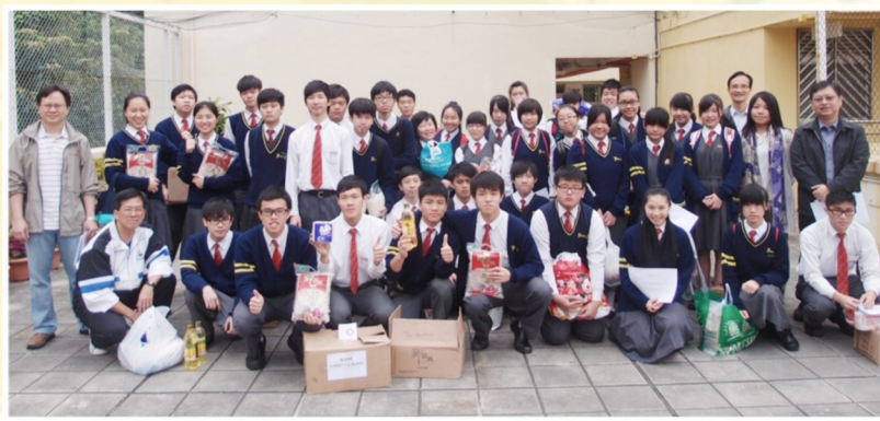
「菩薩行」活動前，先來張大合照