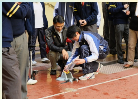
同學小心地把水火箭安放上發射架