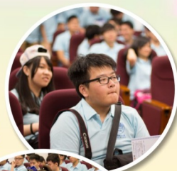
看，我們的 學生多專心！