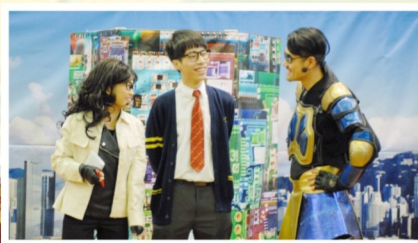
廉政互動劇場《正義聯盟》