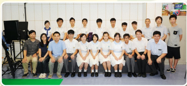
友校佛教沈香林中學，佛教大雄中學蒞臨本校電視台作交流

種器材的使用方法、拍攝技巧、編劇要素及剪接技術；組長們還要學習團隊的管理。日常的實習，使記者隊的媒體製作技巧有所提升，同學的努力亦得到外間專業評判的認同。本年度記者隊的同學獲得了「第48屆工展會全港中學生廣告短片創作比賽」的最佳男主角獎；及由灣仔區議會、香港聲之動力藝術協會、灣仔社團活動中心合辦「基本法微電影創作比賽」的亞軍；部份同學更獲邀擔任「灣仔區青年節2013」閉幕司儀以及「愛分享·愛環保灣仔區嘉年華」的司儀。