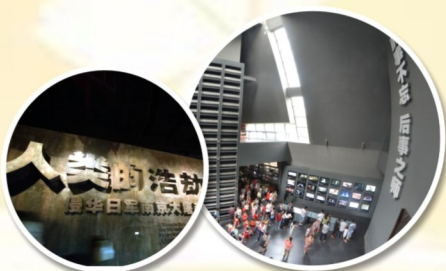
令人哀傷的 歷史印記

這次交流團讓我踏足一般旅行團未必能夠到訪的地方，如上海復旦大學和金陵刻經處。這次旅程，「增添」了我的文化素養。