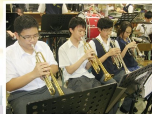
一人一樂器 — 銅管樂班

音樂教育對發掘及培養個人創造力起着重要的作用。本校音樂科於中一級推行「一人一樂器」計劃，要求中一學生須學習最少一種樂器，或加入本校中樂組、銀樂隊、男女聲合唱團其中一個音樂組織，以期更多同學接受樂教薰陶。學校同時鼓勵中二級以上學生繼續參加樂器班，令學生的音樂訓練得以延續。學校每年會安排同學參加校內及校外的表演、比賽及服務，給予同學展現才華的機會。本年度音樂科選派本校中樂團出任「校園音樂大使」，參與由康樂文化事務處主辦的兩場「關懷音樂會」，服務社群。第一場於4月26日與本校義工隊、「扶康會思諾成人訓練中心」合作參演，透過中樂大合奏及各樂器示範，讓「扶康會思諾成人訓練中心」的智障人士，有機會參與一堂音樂課，反應非常理想。第二場是6月29日於藍灣廣場海洋劇場舉行的「匯報音樂會」，此乃「音樂展關懷」的活動總結，我校中樂團與市民大眾分享精彩音樂，更獲大會頒嘉許狀，以表揚我校同學的服務精神。