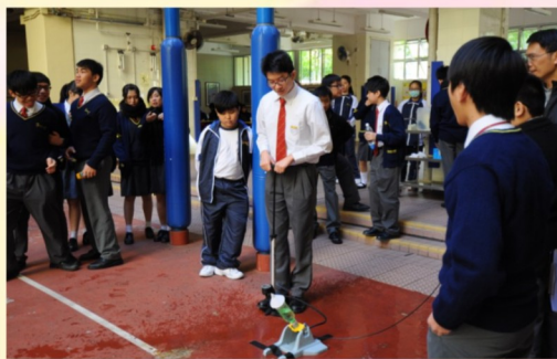
準備為水火箭泵氣