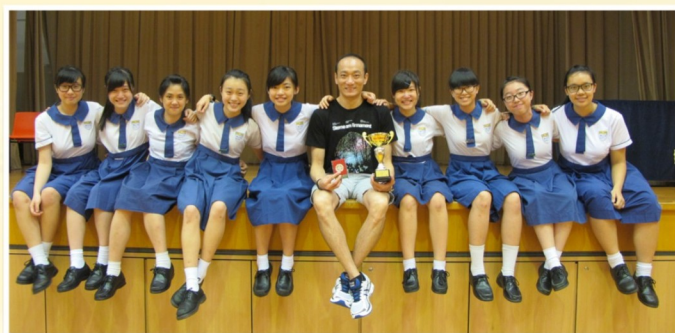
女子排球隊獲獎後與教練合照