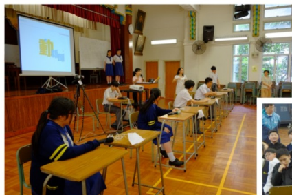
同學積極投入大電視遊戲及班際問答比賽