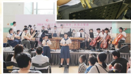
同學在「校園音樂大使」匯報音樂會中落力演出