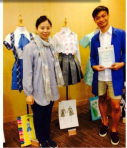
齊欣賞「校服舊變身」的製成品