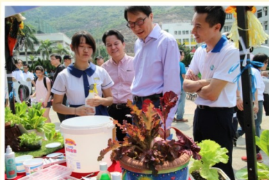
學生細心向參觀者介紹盆栽設計及製作過程。