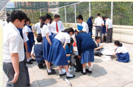
熱熾的求知欲比太陽更高溫