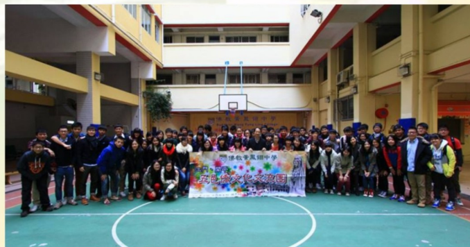
浩浩蕩蕩準備出發