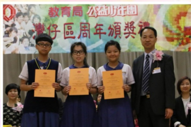
本校公益少年團 獲灣仔區主題活動比賽銀獎