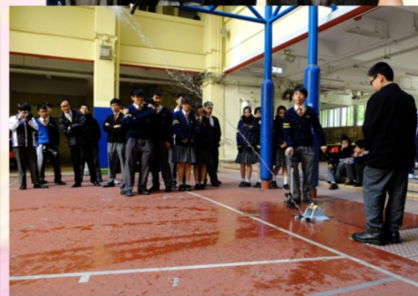
水火箭發射的一刻