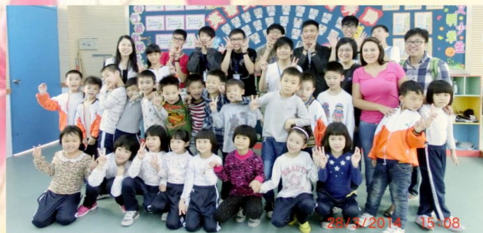
面對佛山市南海大瀝實驗幼稚園的學生，同學都活潑起來。