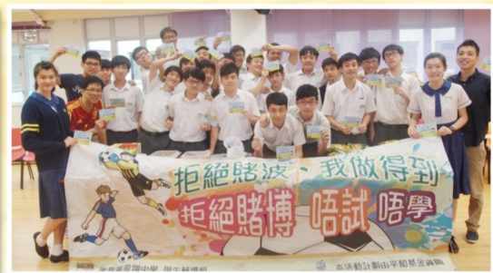
拒絕賭波誓師大會