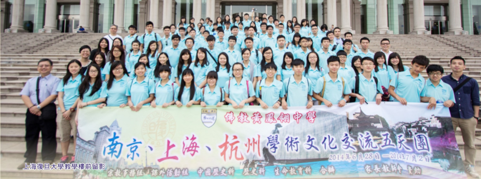
上海復旦大學教學樓前留影