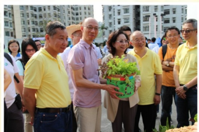
「環保嘉年華」與會嘉賓對學生的作品非常欣賞

藝術發展是新高中「其他學習經歷」的重要組成部分。本校特設「藝術發展科」課堂，並加上課後延伸學習，務求學生於高中三年內享有總課時5%的時間，發展對藝術活動的興趣和鑑賞能力。「藝展科」的教學策略是讓學生輕鬆地透過欣賞、創作、表演及反思等學習活動去了解藝術，不時配合校內科組的活動或對外比賽，鼓勵學生多觀察及接觸身邊的事物，積極投入學校生活，並建立正確的價值觀和態度。就如今年中五級藝術發展科課堂進行的「盆栽設計」，同學以「送上母校55周年的禮物」為構思主題，思考如何利用「廢物」循環再用。有同學用「豬油桶」作素材，再用報紙、竹黏土創作造型，製成一個既實用，又獨一無二的藝術花盆。一個個環保藝術品，配上「日新慈善基金」贊助的有機耕種蔬菜，於4月13日參加杏花邨與環創社主辦的「環保嘉年華」展示成果，而有關作品亦會於下年度本校55周年校慶展出，既向社群宣揚環保訊息，加強同學與社會的聯繫，又增加對學校的歸屬感。期望欣賞及創作成為同學的一種生活習慣。