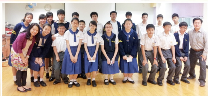
「鳳翎茶聚」師生一起玩遊戲及合照