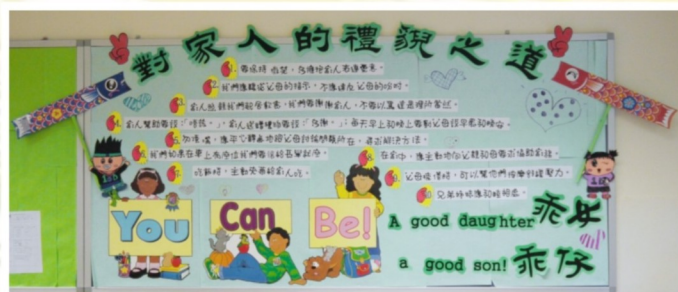
以「禮貌及守規」為題的全校性壁報設計

此外，在上學期以「禮貌及守規」為題，舉辦全校性的壁報設計比賽，各級設計在不同處境下應有禮貌應對方式。一如往年中一級同學，參與「賽馬會青少年德育培訓營」，透過多元化學習活動，培養同學自律精神。