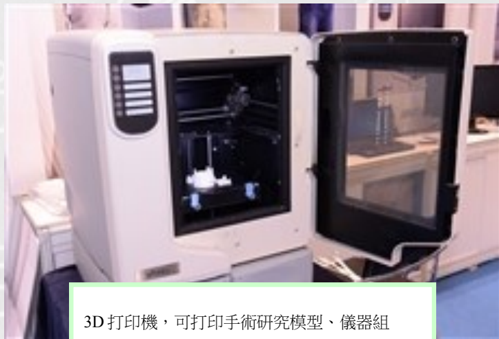
3D 打印機，可打印手術研究模型、儀器組件、度身訂造的固定裝置等 5 。