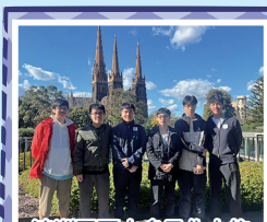
澳洲墨爾本多元化之旅