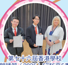
第七十六屆香港學校 朗誦節 (2025) 5冠5亞5季