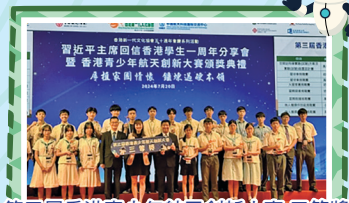
第三屆香港青少年航天創新大賽三等獎