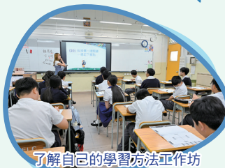
了解自己的學習方法工作坊