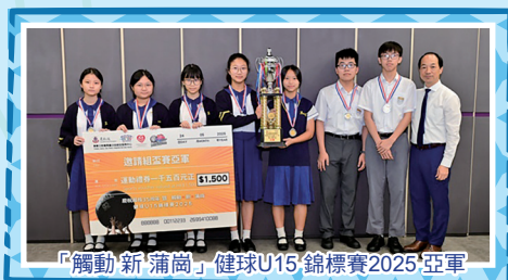
「觸動新蒲崗」健球U15錦標賽2025亞軍