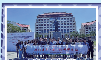
馬來西亞研學之旅