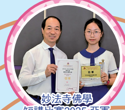
妙法寺佛學 短講比賽2025亞軍