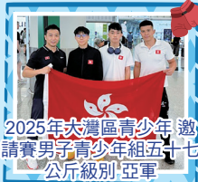
2025年大灣區青少年邀請賽男子青少年組五十七公斤級別亞軍