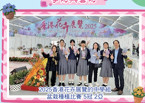
2025香港花卉展覽的中學組 盆栽種植比賽 5冠 2亞