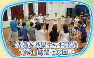
透過遊戲學生互相認識了解，擴闊社交圈子