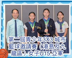
第三屆青少年3X3城市 籃球邀請賽《港島及九龍區》女子U15亞軍