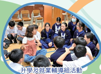
升學及就業輔導組活動