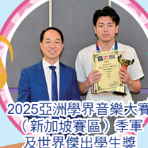
2025亞洲學界音樂大賽 (新加坡賽區) 季軍 及世界傑出學生獎