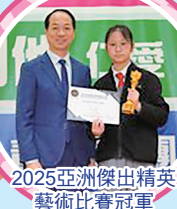
2025亞洲傑出精英 藝術比賽冠軍