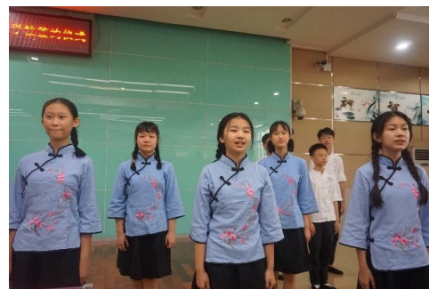
朗誦表演別出心裁，學生聲情並茂，技藝精湛