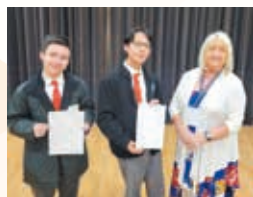
第七十六屆香港學校朗誦節 （2025）共獲5冠5亞5季

All language teachers possess specialized qualifications to enhance students' bilingual and tri-dialect skills. Native English Teachers facilitate diverse activities, including English drama, fun workshops, carnivals and so on. Students excelled in the "Liwen Cup" 3 rd Chinese Culture and Tourism Knowledge Competition, securing individual and team 2 nd place and 3 rd place awards. They also attained significant success