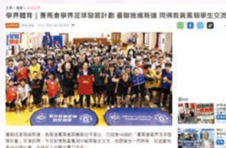
賽馬會足球學界發展計劃——曼聯名宿到訪