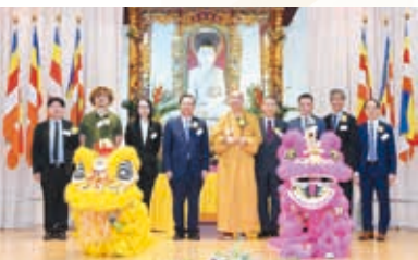
多位地區人士到校參與佛誕啟動禮