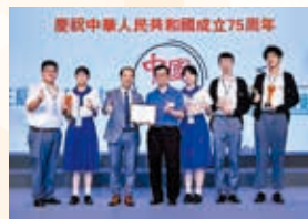
第三屆中國文化和旅遊知識競 賽奪得2亞2季

每年以有趣主題推行跨課程學習計劃，包括「神奇寶石」、「AIG: 動漫遊戲」、「中國古代休閒娛樂」等，鼓勵學生融會貫通，實踐所學，安排備受本地媒體報導。初中推行跨科專題研習，讓學生透過合作、實踐及匯報掌握各種共通能力，達致完整的學習訓練。專題研習指導老師更獲消費者委員會頒發指導老師獎。學校發掘資優學生，學生獲選參加本地不同大學學府舉辦的資優課程。學校又鼓勵自主學習，2024年學生於初中科學線上自學計劃中獲4名金獎、5名銀獎及1名銅獎。