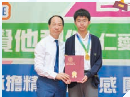
2025全球青少年農曆新年繪畫大賽（高中組）超級金獎