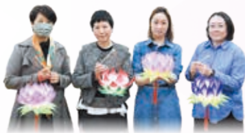
親子蓮花燈製作班

The School values communication between parents and school, establishing a Parent-Teacher Association in 1999. Parent representatives are official members of Purchase and Procurement Committee and work for the sole interest of students. Parents received the "Kong Hong Outstanding Parent Volunteer" award from the Hong Kong Island District Parent-Teacher Association in 2025. Parents also actively participate in the "10,000 Steps Walking Challenge 2024" organized by the Department of Health, with teachers, students, and parents receiving commendations.