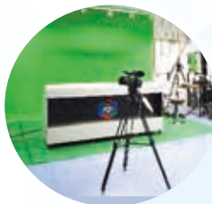
媒體创新中心 Media Innovation Unit