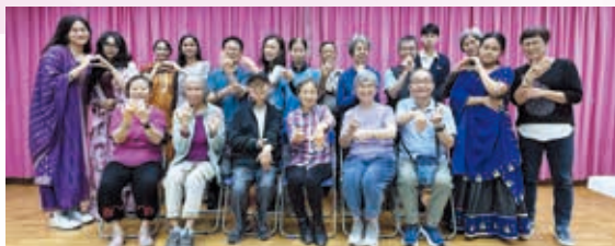
長者學苑計劃：多元文化交流（印度手繪）