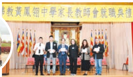
第二十六屆家教會幹事就職禮