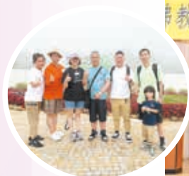
親子中華文化考察之旅