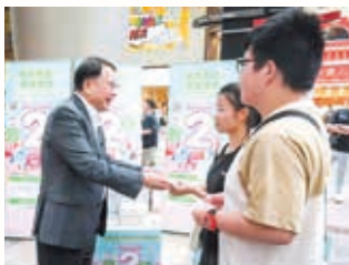
學生參加政制及內地事務局舉辦的登記選民活動