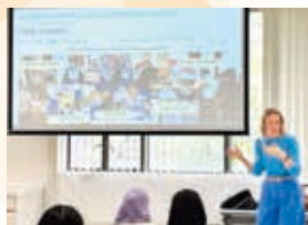
外籍英語老師獲教育局邀請， 分享以英語活動推廣正向人生

學校著意提升學生兩文三語，舉辦多樣化英語學習活動：英語話劇、趣味工作坊、遊藝會等。外籍英語老師獲教育局邀請，分享以英語活動推廣正向、尊重等價值觀。學校在大公文匯及中國文化傳媒集團有限公司合辦的「理文盃」第三屆中國文化和旅遊知識競賽中，初中及高中兩組各於個人組和團體賽中奪得2亞及2季軍；為香港學校朗誦節獎台常客，在第七十六屆香港學校朗誦節（2025）中屢獲殊榮，共獲5冠、5亞、5季及多個優良和良好獎狀；學生在深圳讀書月組委會辦公室主辦之「中學生讀書交流活動香港區讀書隨筆寫作比賽」獲高中組特等獎。