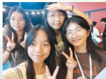
馬來西亞研學之旅