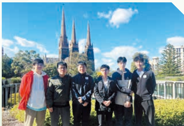
參觀澳洲墨爾本西式建築