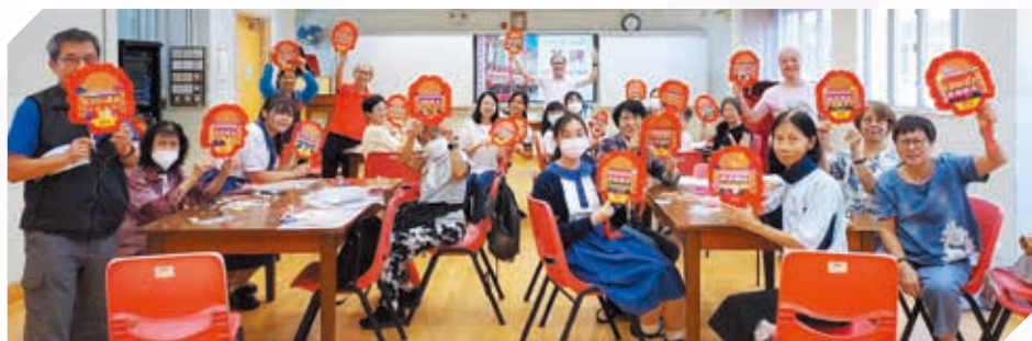
喜慶花牌製作工作坊