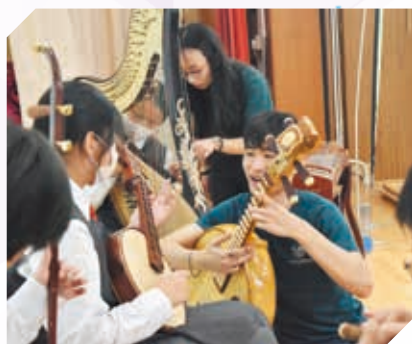
天樂音樂學院——國蘊Teen樂計劃教育專場音樂會