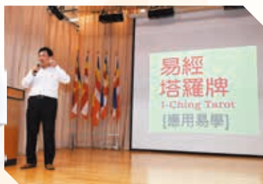
Sharing Corner-易經 塔羅牌