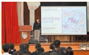
中三級「應用學習課程簡介會」