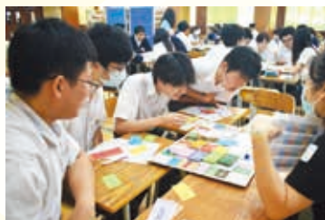
中四級理財決策工作坊