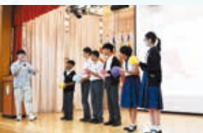
初中精神健康講座