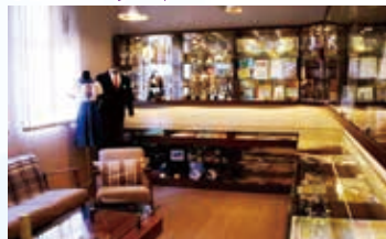
校史室 Fung Ling Time Capsule