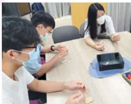
皮革御守製作工作坊