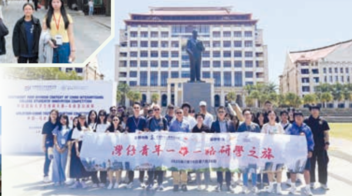
馬來西亞研學之旅