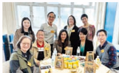
家長也一起慶祝藍寶石禧校慶