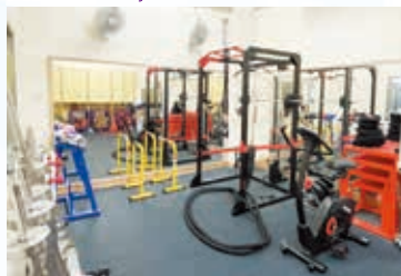
健身室 Gym Room