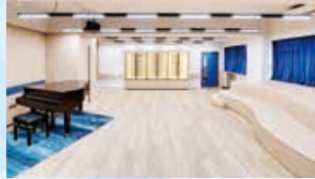
音樂室 Music Room

We have 25 standard classrooms and 4 laboratories, plus New Assembly Hall, English Corner, Fung Ling Time Capsule, Multi-purpose Student Activity Center, STEAM Lab, Hydroponic Garden, Library, Makerspace, Study Corner, Media Innovation Unit (MIU), Meditation Corner, Piety Auditorium, Fitness Room, conference rooms, etc.