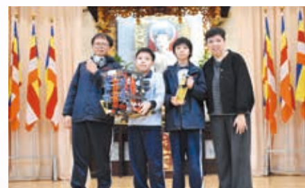
灣仔區青少年發展協會： 活力灣仔·躍動校園2024