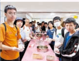
家長與學生製作傳統糕點