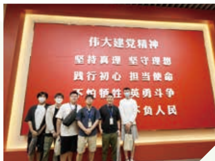
上海參觀中共一大會址