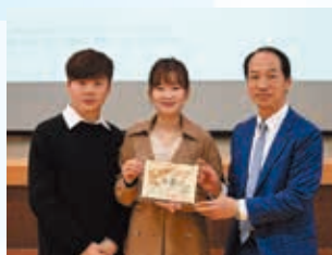
正向思維和健康心靈分享