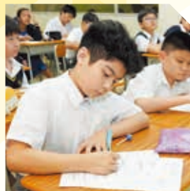
中一級「自我管理」工作坊

The School upholds the philosophy of a 6-year life planning for students and organizes various activities at all levels to boost students' self-understanding for setting life goals.