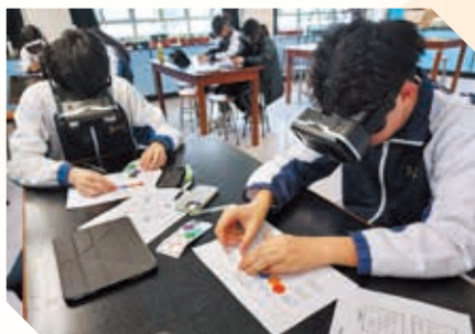
運用AR科技模擬眼睛疾病的體驗式學與教活動