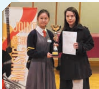
聯校音樂大賽2025中學中樂(古箏獨奏)高級組金獎

學校推行「一人一樂器計劃」，又注重藝術教育。中樂團在 2024 聯校音樂大賽中獲金獎，同時更於第五屆全港十八區音樂比賽（中樂組）獲冠軍。學生在第十八屆香港（亞太區）音樂大賽古箏少年 A 組金獎、聯校音樂大賽 2024 中學中樂（古箏）獲獨奏一高級組金獎；第十五屆國際古箏比賽香港區選拔賽非專業自選曲目 A 組金獎。學生於香港當代藝術學院主辦的 2024 新春兒童繪畫比賽獲得優異獎；文化藝術專才協會舉辦 2025 全球青少年農曆新年繪畫大賽（高中組）獲超級金獎。