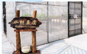
水耕農圃 Hydroponic Garden