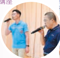
家長於音樂會獻唱