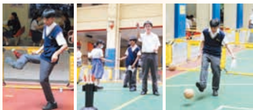
中國古代休閒娛樂-蹴鞠、投壺、毬子

Each year, interesting thematic cross-curricular learning projects are implemented, including "Magical Gems," "AIG: Animation and Games," and "Ancient Chinese Leisure Activities," encouraging students to integrate their learning and apply what they have learned, which has been widely reported by local media. Junior students engage in cross-subject thematic studies, allowing them to master various skills through collaboration, practice, and reporting. The teachers were awarded the Guiding Teacher Award by the Consumer Council. Students are selected to participate in various gifted programs organized by local universities. The School also encourages self-directed learning. In 2024, students achieved 4 gold medals, 5 silver medals, and 1 bronze medal in the Online Self-Learning Program for Science (Junior).