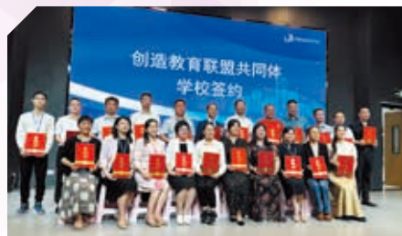
首間香港中學獲邀成為大灣區「創造教育聯盟共同體」的成員