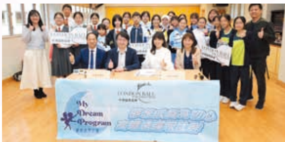
中華倫敦協會夢想成真計劃

Our School places great importance on collaboration with the community, enriching students' learning resources and opportunities.