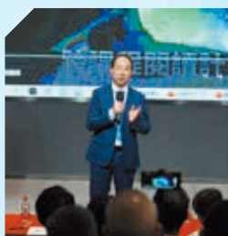
《香港的科學教育》分享講座 賽馬會足球學界發展計劃——英國交流