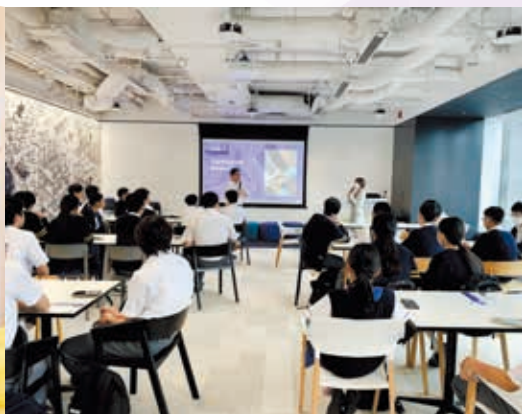
參觀畢馬威行政人員招聘服務有限公司