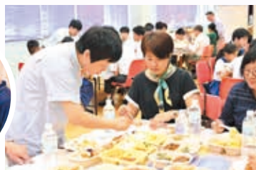
家長試食學生飯盒