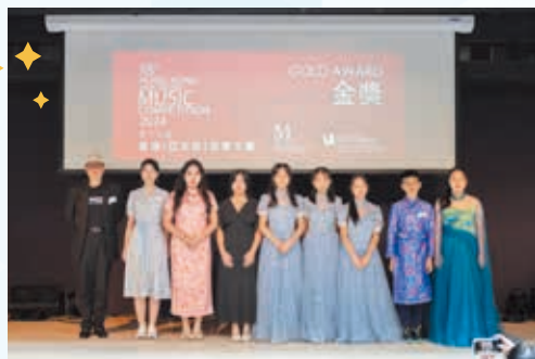
第十八屆香港(亞太區)音樂大賽古箏少年A組金獎

學校推行「一人一樂器計劃」，又注重藝術教育。中樂團在 2024 聯校音樂大賽中獲金獎，同時更於第五屆全港十八區音樂比賽（中樂組）獲冠軍。學生在第十八屆香港（亞太區）音樂大賽古箏少年 A 組金獎、聯校音樂大賽 2024 中學中樂（古箏）獲獨奏一高級組金獎；第十五屆國際古箏比賽香港區選拔賽非專業自選曲目 A 組金獎。學生於香港當代藝術學院主辦的 2024 新春兒童繪畫比賽獲得優異獎；文化藝術專才協會舉辦 2025 全球青少年農曆新年繪畫大賽（高中組）獲超級金獎。