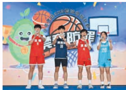
港島總區防騙籃球培訓計劃