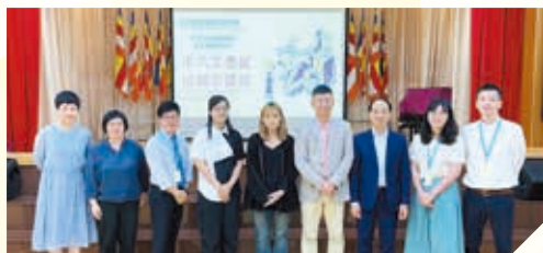
中六級放榜前講座

Self-management workshop held for S.1 to nurture ideal learning habits and value; "I can Make It" programme in S.2 help students with goal-setting; For S.5, "Road to University" and Aptitude Test Workshop boost students' understanding of job interview skills for responsible life planning. For S.6, group counselling helps students sharpen their aspirations for future.