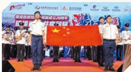
獲民政處邀請於大型社區活動擔任升旗及護旗手

The School aims to cultivate students' civic awareness and sense of social responsibility through regular community service work.