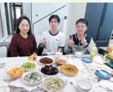
上海交流家庭的招待