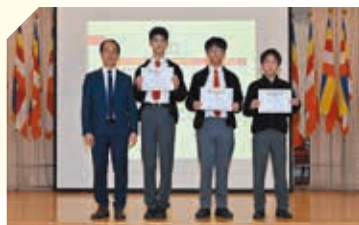
中二級「我做得好」計劃