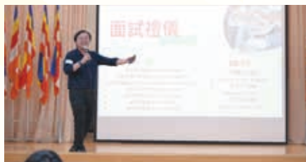
中五級面試技巧講座

初中：中一級舉辦「自我管理」工作坊，協助學生培養良好的習慣及價值觀；中二級舉辦「我做得好」計劃，協助學生訂定目標，又有「職業性向測試工作坊」，通過活動協助學生測試個人性格類型及了解個人職業發展取向；中三級舉辦「應用學習課程簡介會」和高中選課策略。