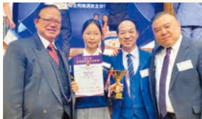
連續多年獲選為「香港島傑出學生」

學校獲「香港義工獎」愛心學校 2025 獎狀。學生獲社會福利處署推廣義工服務協調委員會頒受傑出義工獎狀 3 名、優秀義工獎項 39 名。園藝學會又將種植成果於探訪獨居長者時贈予有需要人士。學會在 2025 年康樂及文化事務署主辦「香港花卉展覽」中學組獲 4 冠 2 亞佳績。鳳翎升旗隊獲香港警務處 2023 少年警訊中式升旗比賽中學組港島分區亞軍。學校屢獲公益少年團灣仔區主題活動比賽金獎，連續多年蟬聯「傑出團員獎」，到海外進行交流。學生更連續多年獲選為「灣仔區傑出青年」、「香港島傑出學生」等。學生獲選參加「香港青少年軍事夏令營」，又參與教育局「和諧校園計劃」，9 名學生「和諧大使」獲頒聯盟嘉許獎。