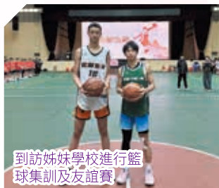
到訪姊妹學校進行籃球集訓及友誼賽