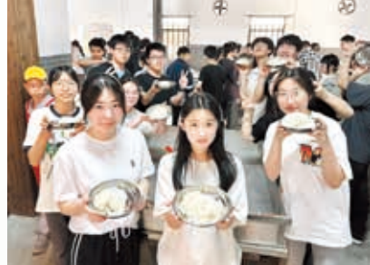
紹興糕點製作體驗