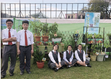
2018「藍天綠地在香港·全港學界環保設計比賽」中學組總冠軍