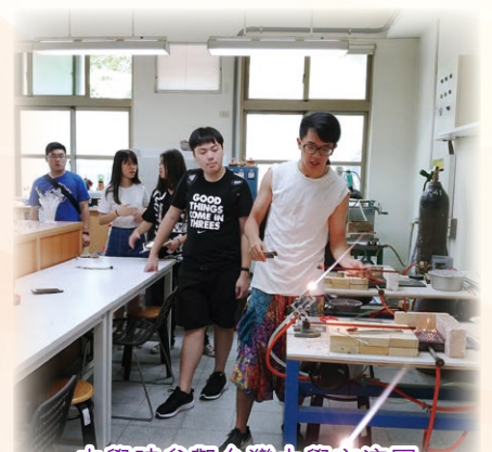
中學時參觀台灣大學交流團

最後給大家一個忠告，台灣大學易入難出，能夠入到心儀的大學只是一個開始，不能完成四年課程就要靠自己發奮圖強了！