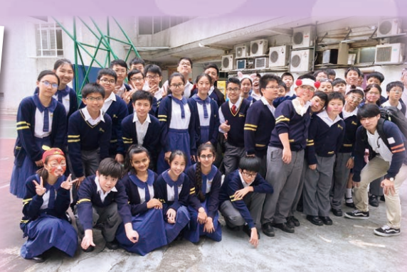
中一及中二級英詩集誦季軍