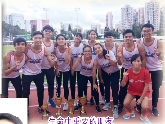
生命中重要的朋友