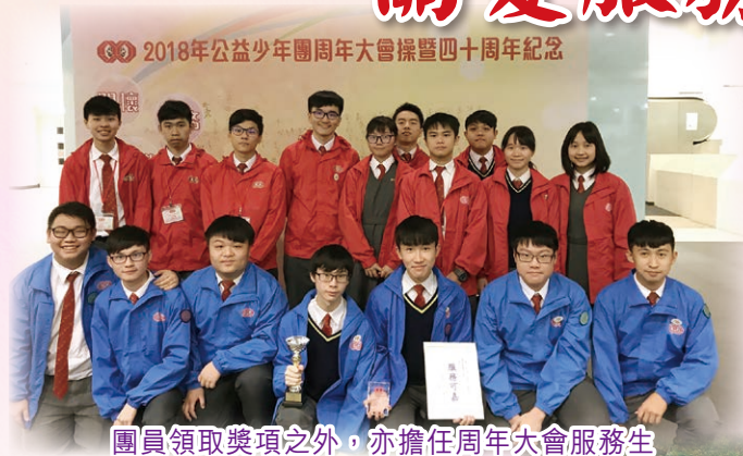
團員領取獎項之外，亦擔任周年大會服務生

本校公益少年團員本著「認識、關懷、服務」的宗旨，關心社會，參與不同類型的社會服務，表現出鳳翎人「關愛有禮、熱心服務」的精神。公益少年團每年舉辦各類型的活動，其中「主題活動」最具挑戰性，本校團隊老師及同學發揮創意，設計服務長者的活動，於2015、2017及2018年均獲得「灣仔區主題活動金獎」，表現卓越，屢獲嘉許。