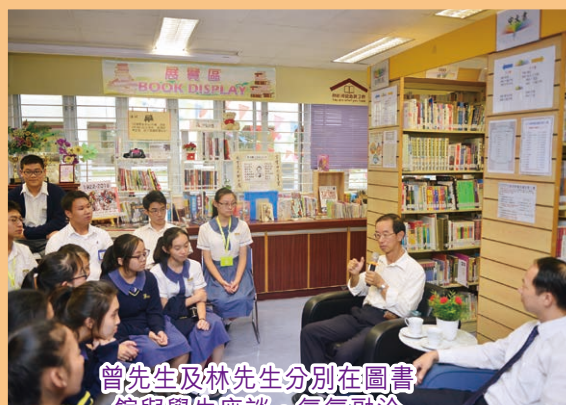
曾先生及林先生分別在圖書館與學生座談，氣氛融洽