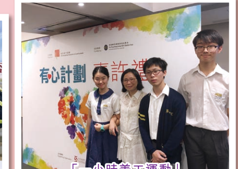
「一小時義工運動」 最積極參與獎銀獎