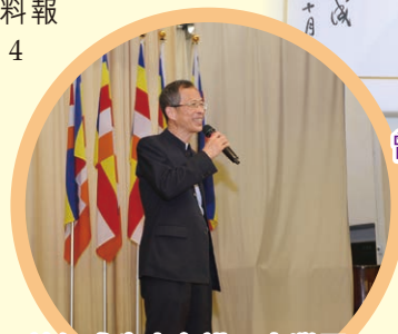
曾鈺成先生主講：大灣區 發展與香港青年人關係