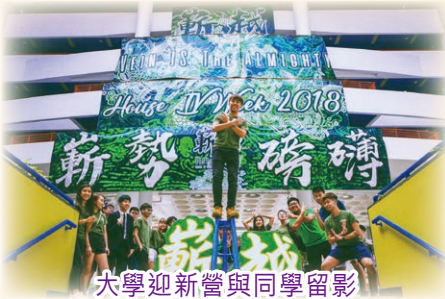
大學迎新營與同學留影

當年來到佛教黃鳳翎中學，令我最印象深刻的就是學校會舉辦各種各樣的活動，豐富我們的校園生活，例如英文週，中國文化週等。這些活動不單單能增進我對不同學科的興趣，還能促進同學們之間的友誼。我還記得在中二時參加中國文化週的活動，需要舉辦時裝展覽，同學們會分組合作，設計並完成屬於自己的服裝，合作期間增進了我對他們的了解，讓我更快融入新的朋友圈，實在是難忘的回憶。另外，母校也給予學生很大的自由度，促進學生全人發展。學校允許學生嘗試運作不同的學社，舉辦不同的活動，例如普通話社要籌辦普通話歌唱比賽，讓同學們在學業外也能培養領導能力。