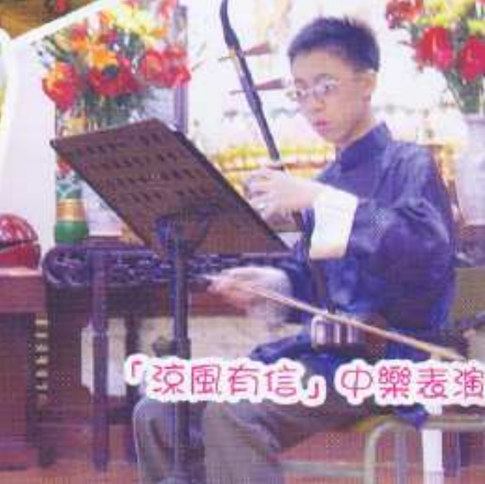
「涼風有信」中樂表演