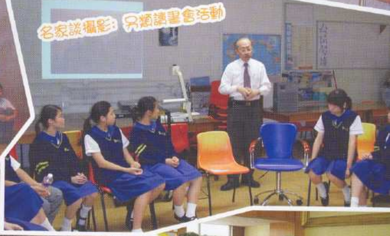
名家談攝影：另類讀書會活動