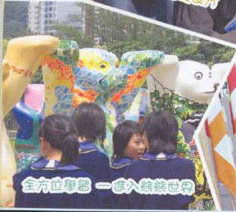
全方位學習——進入鯊鯊世界