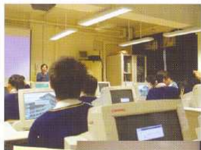
↑ 電影製作過程中，同學都認真學習，務求‘做番啱好戲佢人睇’。