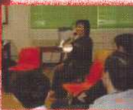
孫女士跟參加者分享閱讀