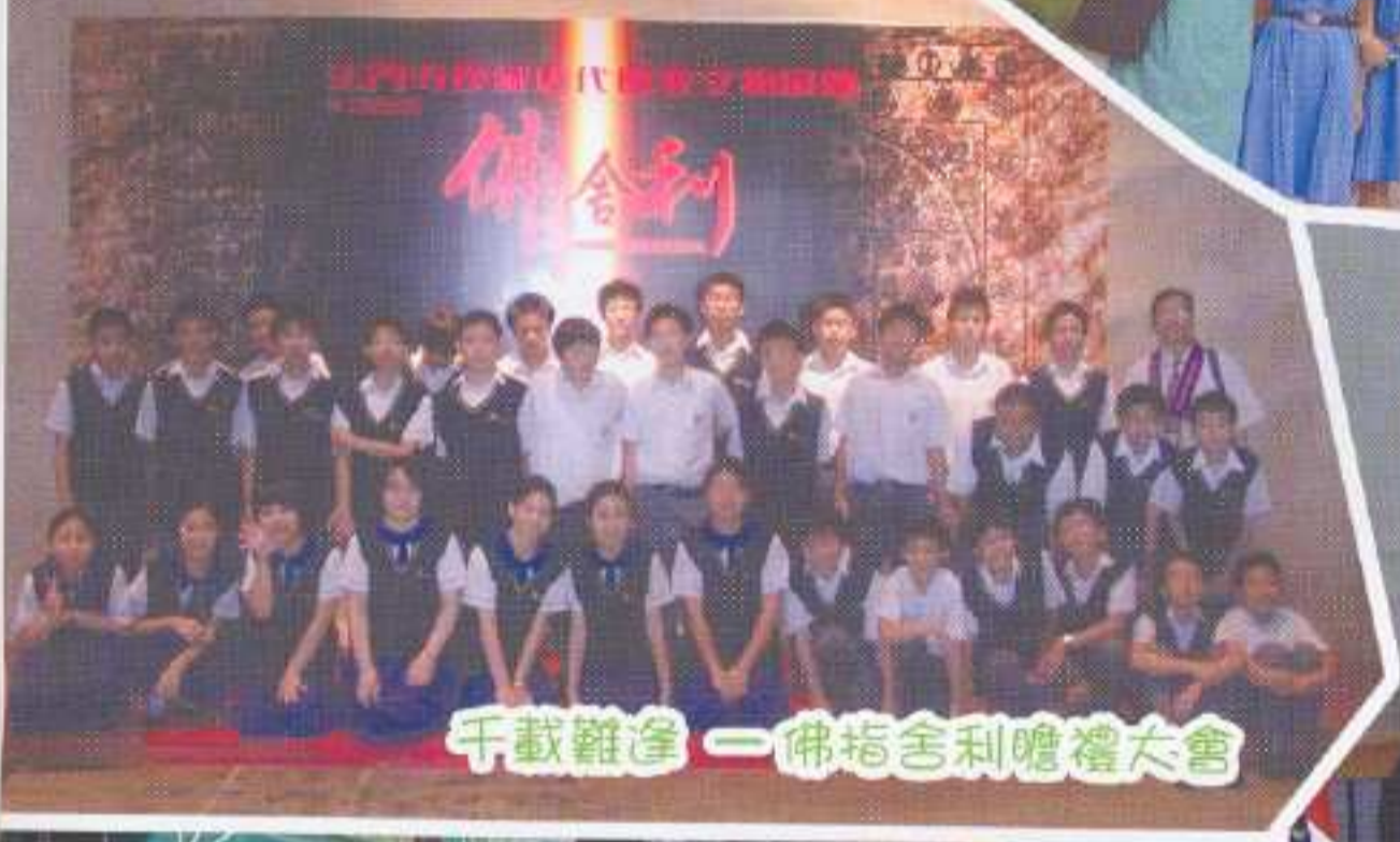
千載難逢——佛指舍利瞻禮大會