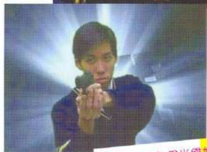
同學的扮相都幾咁維妙