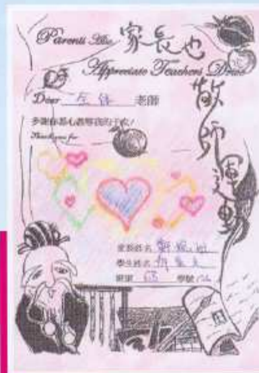
本會設計的敬師咭