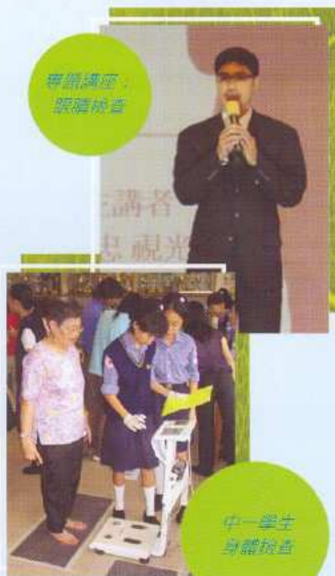
中一學生身體檢查