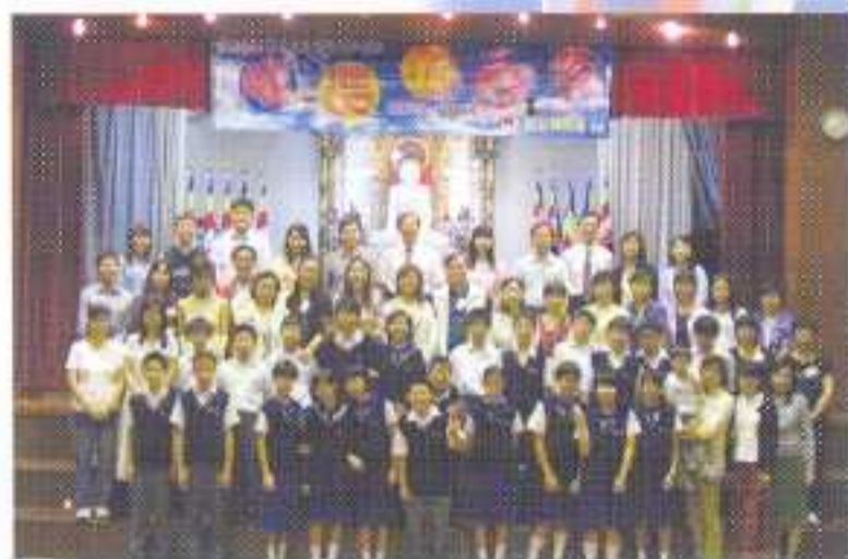
結束禮晚會上校長、老師、社工、家長及中一學員大合照

計劃內容甚豐，共二十多節活動，當中包括：提高學生抗逆能力的教育活動（成長工作坊、愛心義工之旅、備戰日營、挑戰者再戰訓練營及檢閱行動）、教師工作坊、家長工作坊、親子活動（親子日營）、「啟動禮」及「結束禮」，由有關輔導老師、班主任及社工負責。