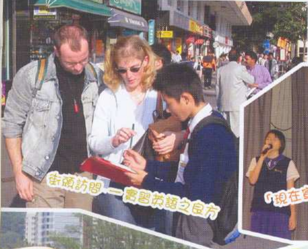
街頭訪問——學習英語之良方