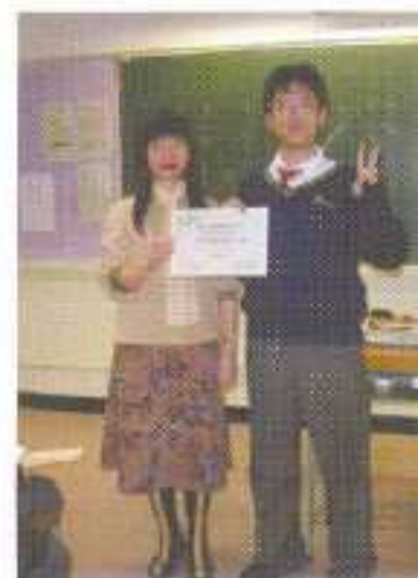
畢業禮上嘉獎組員

本計劃由「東華三院越峰成長中心」協辦，對象為中二至中三學生。內容包括：六次工作坊（包括：互動遊戲、模擬處境研討、個人分享、戶外活動等）及畢業禮。