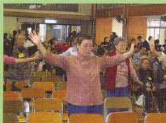
台下觀眾亦手舞足蹈