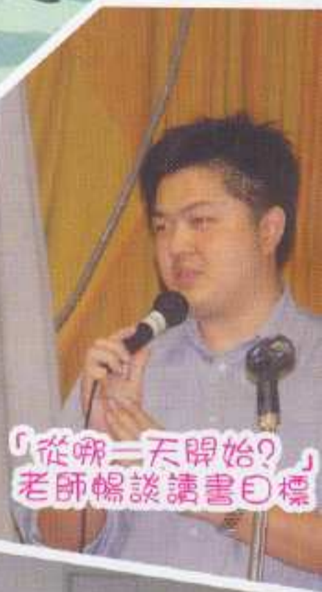
「從哪一天開始？」老師暢談讀書目標