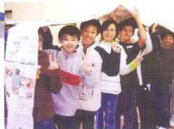
備戰日營：坦克車活動