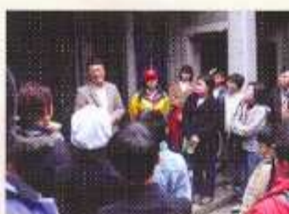
團員細心聆聽導賞員的講解