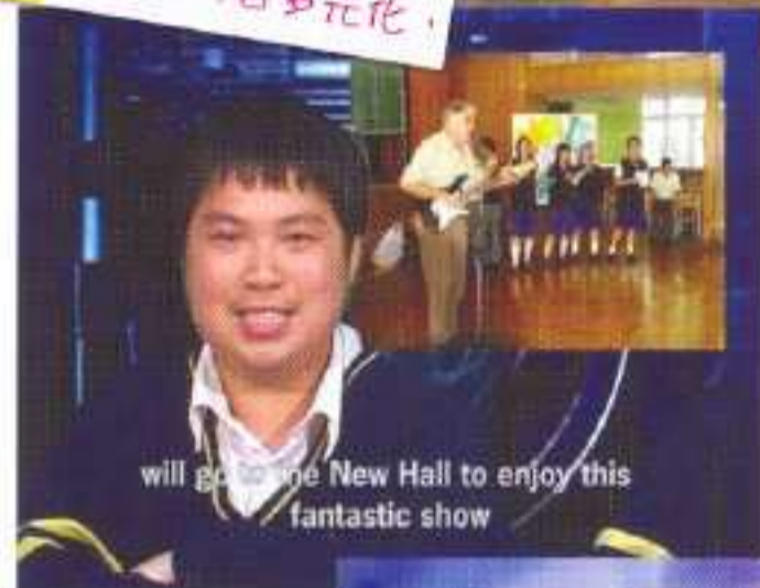
will go to the New Hall to enjoy this fantastic show