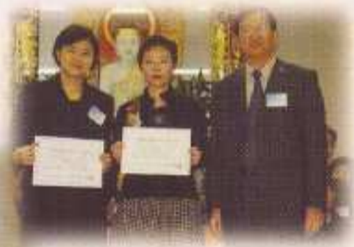
丘瑞昌校長頒發 委任狀予各常委