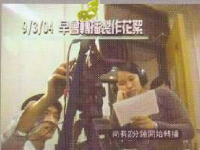
▲ 攝影、燈光、收音等工作皆由同學親力親為。

另外，MIU 在午膳時，於學生飯堂及各初中課室轉播當日的電視台午間新聞節目，讓同學可以及時了解到本港、內地和國際大事，培養同學關心社會的公民意識。同時，MIU 還利用此時段播放校內其他資訊，如活出中國文化計劃簡介、陸運會花絮、環保回收活動宣傳片和英文好書推介等，使同學於課餘亦可接收富教育意義的訊息。