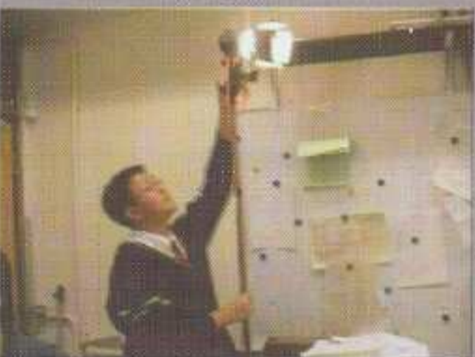
▲ 看我們的同學多投入！