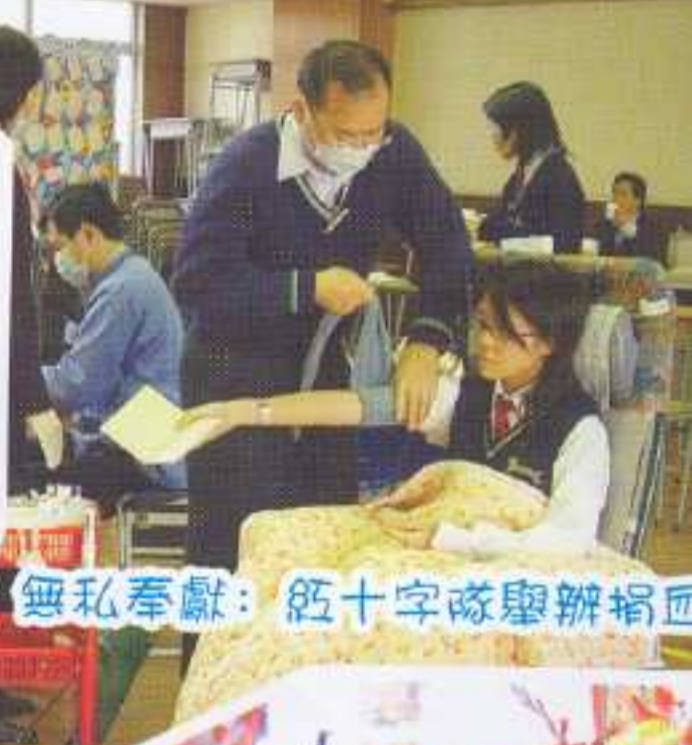
無私奉獻：紅十字隊舉辦捐血