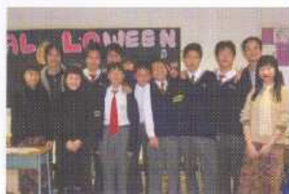
輔導老師、社工、班主任及學員大合照

為協助學生思考沉迷網吧對個人身體狀況、家庭關係、朋友溝通等各方面的影響，從而幫助他們尋回現實中遺忘的樂趣、定立現實生活目標及先後次序，在2003年10月至12月期間舉辦「廿二世紀殺人網吧小組」。