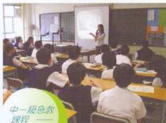
中一級急救課程——理論課