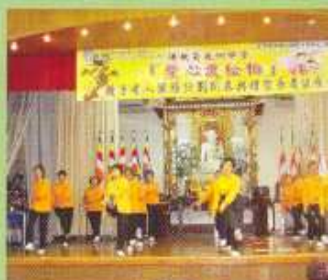
長者充滿動感的表演