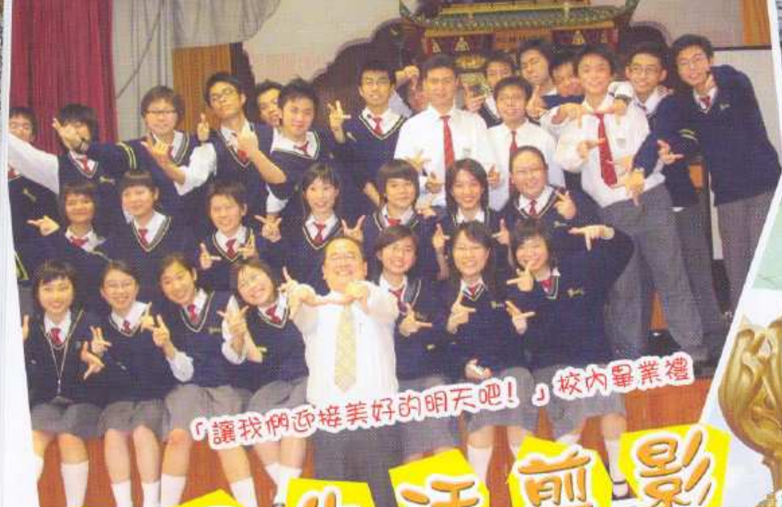
「讓我們迎接美好的明天吧！」校內畢業禮