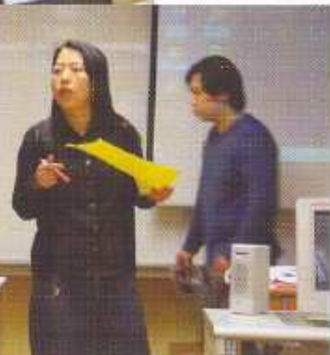
凍紫烟老師連同校外專業機構的導師負責該電影製作課程。