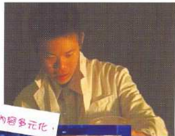
我們的節目內容多元化，