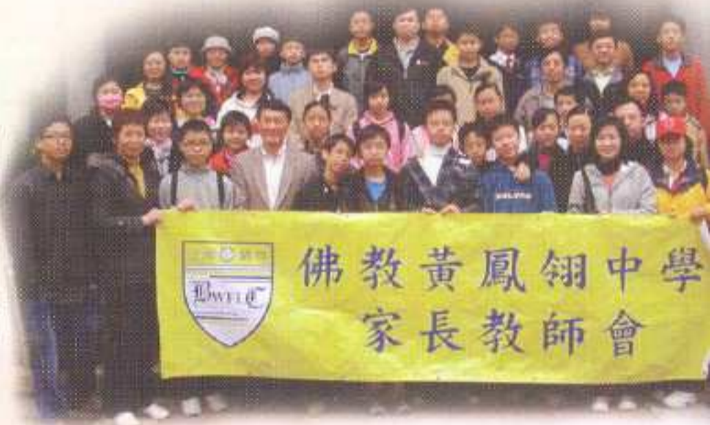
所有參加者的大合照