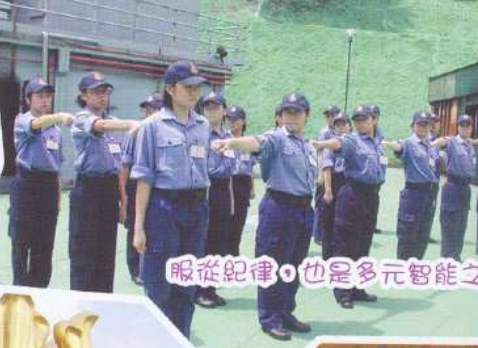
服從紀律，也是多元智能之