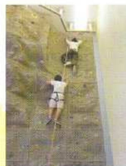
室內攀爬：體驗網上遊戲以外的自我挑戰