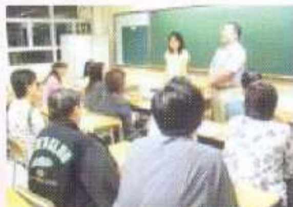
分班解答家長的疑問