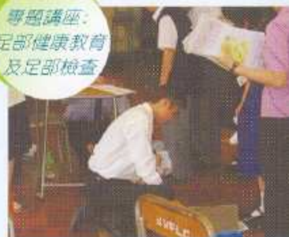
專題講座：足部健康教育及足部檢查

校務組的工作，就是讓學生多了解自己的身體及學習環境，學會管理及鍛煉身體，並保養及愛惜學習環境，共同創建『健康校園』。