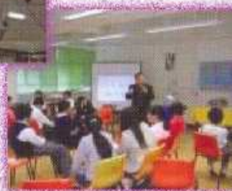
閱讀工作坊的進行情況