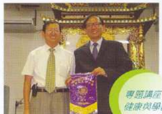
專題講座：健康與學習

本校一向十分著重學校衛生環境及學生的身體健康，故本年度於校務組下，特設『健康校園』小組。顧名思義，『健康校園』小組的目標是建立一個舒適健康的校園環境，增加教職員及學生的工作及學習能力。所謂『預防勝於治療』，故『健康校園』小組，除建立一套完善的學校健康政策，更於學校環境、校風與人際關係、社區關係、個人健康技能、健康服務等五方面，進行多項活動，讓教師及學生的身心得以平衡發展，從而締造健康的校園生活。