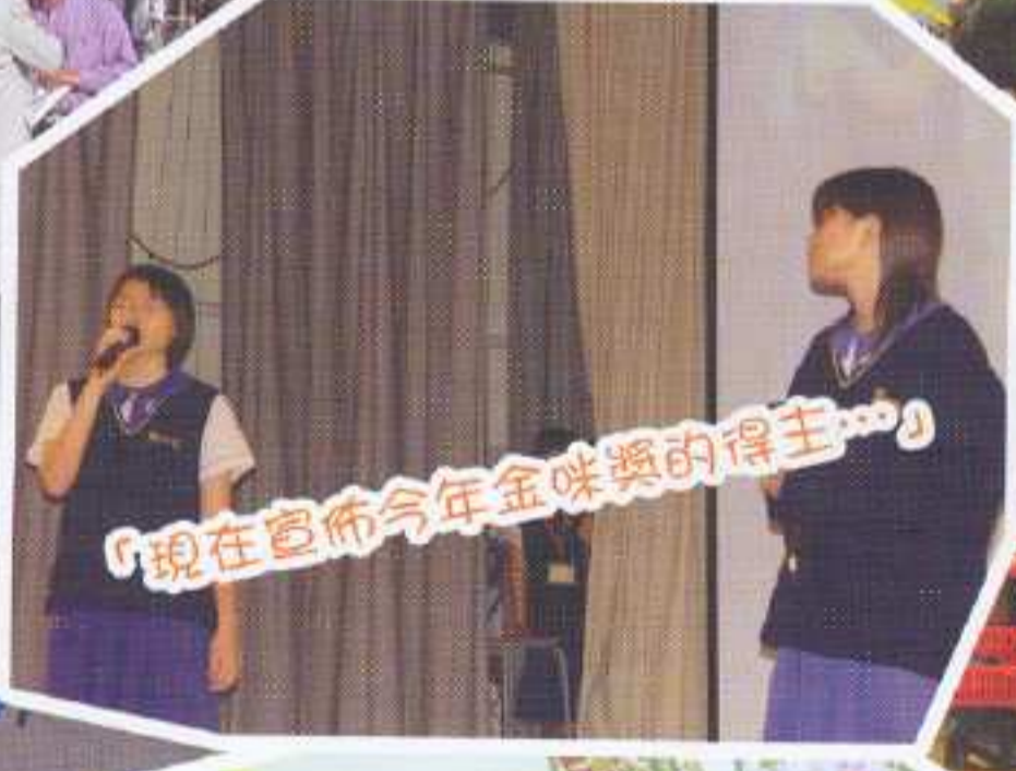
「現在宣佈今年金味獎的得主……」