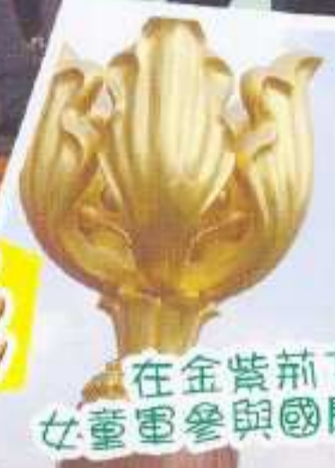
在金紫荊下：女童軍參與國慶升旗禮