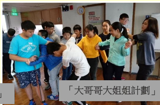
「大哥哥大姐姐計劃」