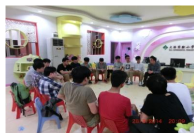
「職涯探索佛山之旅」