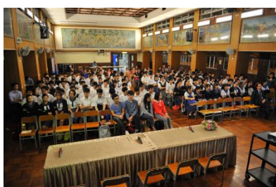
「中六學生升學家長會」

對外聯繫可增加推行有關「生涯規劃」活動之財政及人力資源。2013年曾安排學生參加由國際成就計劃香港部主辦的《成功技巧工作坊》，活動是由任職商界的義工帶領，以小組形式，與學生分享職場的溝通技巧及團隊精神，並指導學生撰寫履歷及求職面試的技巧。2014年舉辦的《職涯探索佛山之旅》是由校友會及佛教青少年中心資助，活動讓學生了解中國的發展潛力及工作時的應有態度。另外，邀請家長出席有關升學講座能提升家長的參與，協助子女規劃前途，上學年的家長講座包括中三選科家長會、中六學生升學家長會及文憑試放榜前講座。