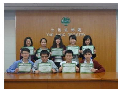
「應用學習課程簡介會」 「教育及職業博覽展」 「工作影子計劃」