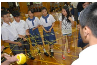
「升中一暑期班 —— 自我認識工作坊(1)」