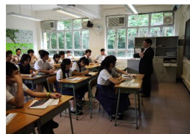
「JUPAS 選科策略及大學課程初探」 「一起走過文憑試的日子」 「高中多元升學出路」