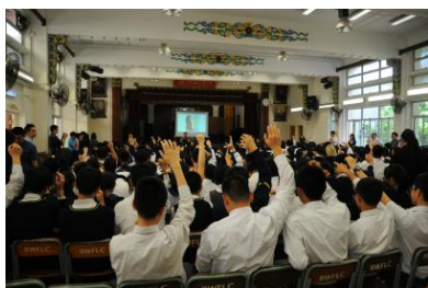
初中週會「生涯規劃 自我認識」