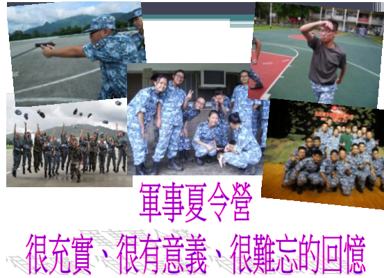
軍事夏令營 很充實、很有意義、很難忘的回憶