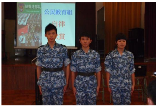
軍事夏令營分享會

香港青少年軍事夏令營分享會、以「禮貌及守規」為題的全校性壁報設計、中一級德育培訓營、各級配合學校德育主題的公民教育課等等。