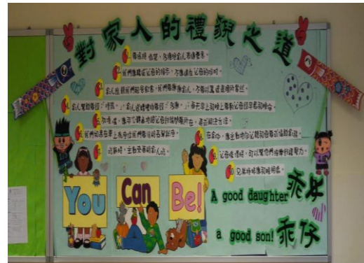
以「禮貌及守規」為題的全校性壁報設計