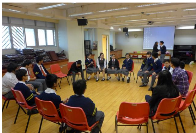
透過遊戲及茶點讓同學體會關愛精神