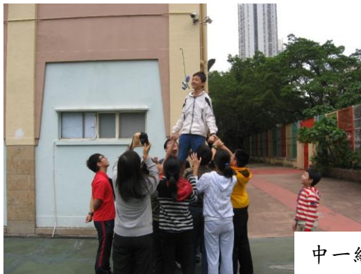
中一級德育培訓營