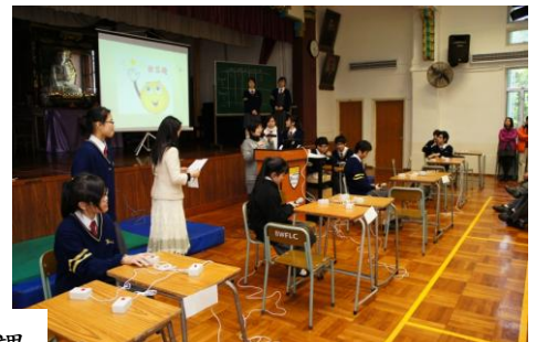
配合學校不同德育主題的公民教育課